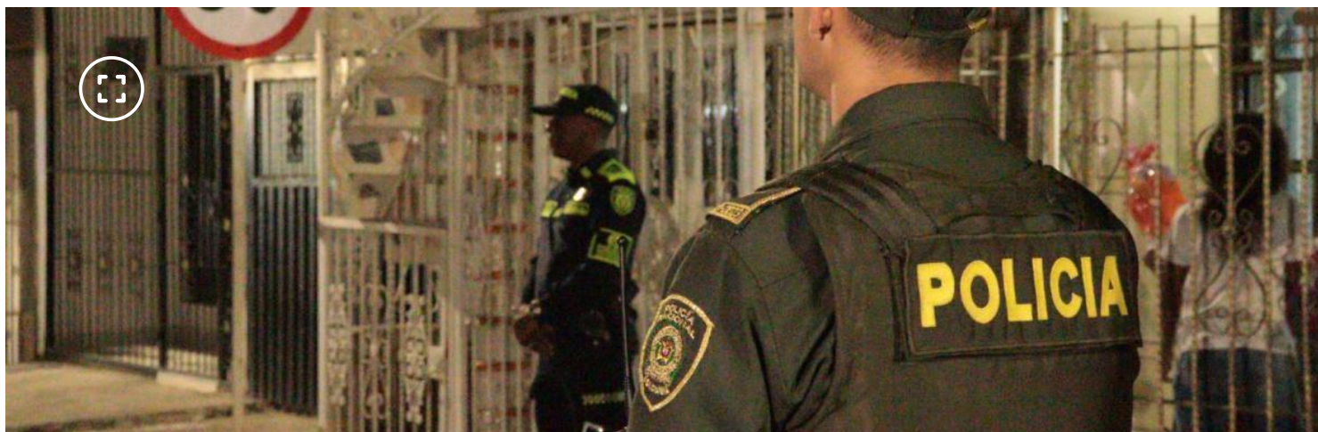
Policías intensifican la búsqueda en el oriente de Cali.

Autoridades intensifican labores de búsqueda del menor. Piden la solidaridad de la ciudadanía.