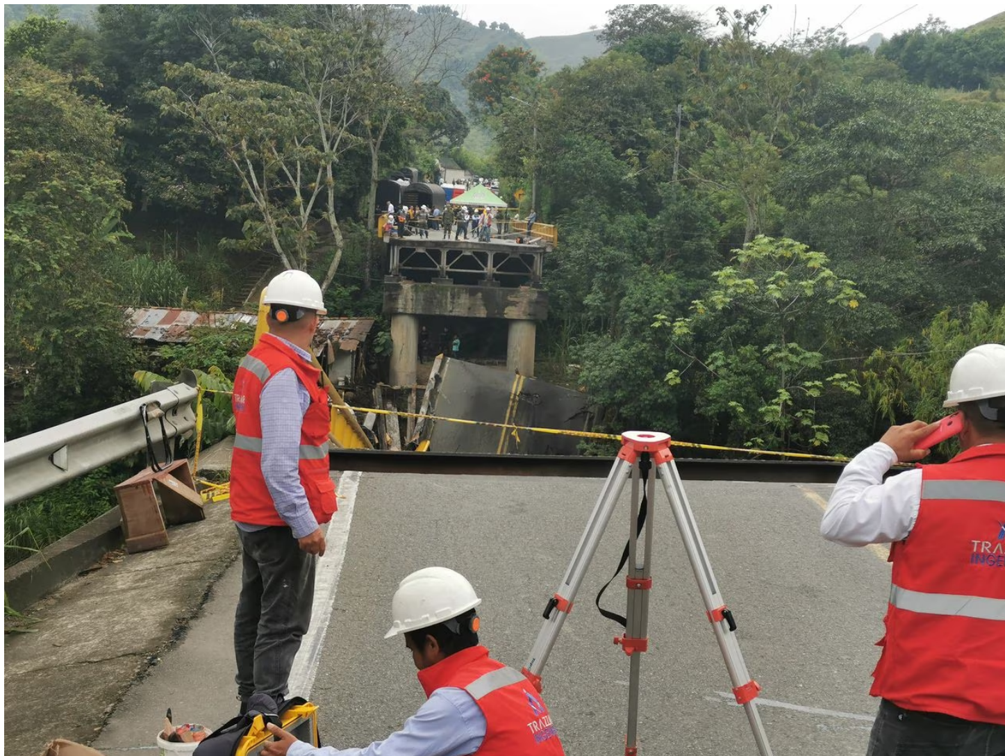
Caída del puente del Alabrado sobre el río la Vieja en los límites entre los departamentos del Valle del Cauca y Quindío.

Las comunidades de poblaciones como Quebrada Nueva, Corozal y Buenos Aires, que están muy cerca del puente sobre el río La Vieja , han afrontado serios problemas de comunicaciones, sin contar los ingresos que han dejado de recibir porque por la zona ya no pasa el transporte de carga.