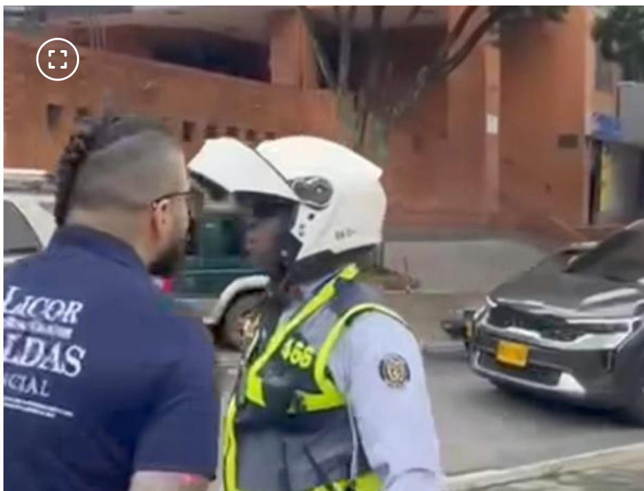
Un hombre lanzó insultos a agente de tránsito en Cali.