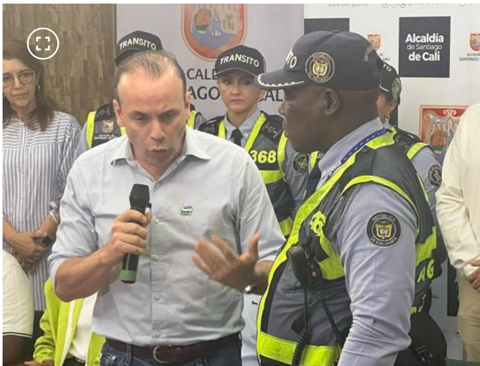
El alcalde de Cali con el agente de tránsito agredido.

Comunicado de distribuidor de Licorera de Caldas.