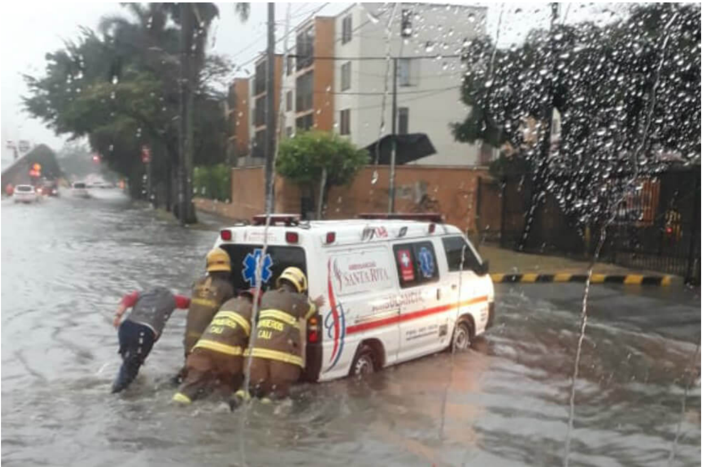
Las lluvias sobre la ciudad comenzaron alrededor de las 2 a.m. de este jueves.

Hasta el momento se han reportado seis árboles caídos y ocho inundaciones en diferentes barrios de la ciudad.