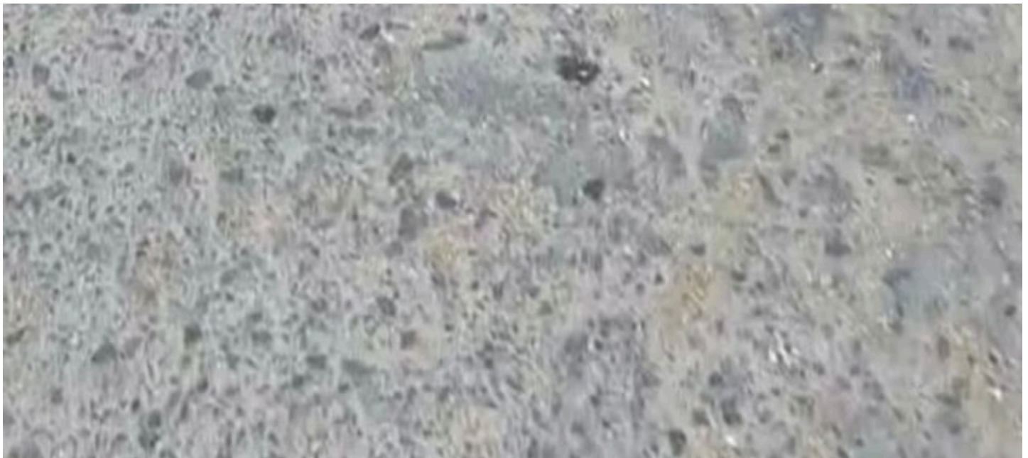
La Secretaría de Infraestructura explicó que las Calles 18N y 22N están dentro de los procesos de revisión técnica para futuras intervenciones.