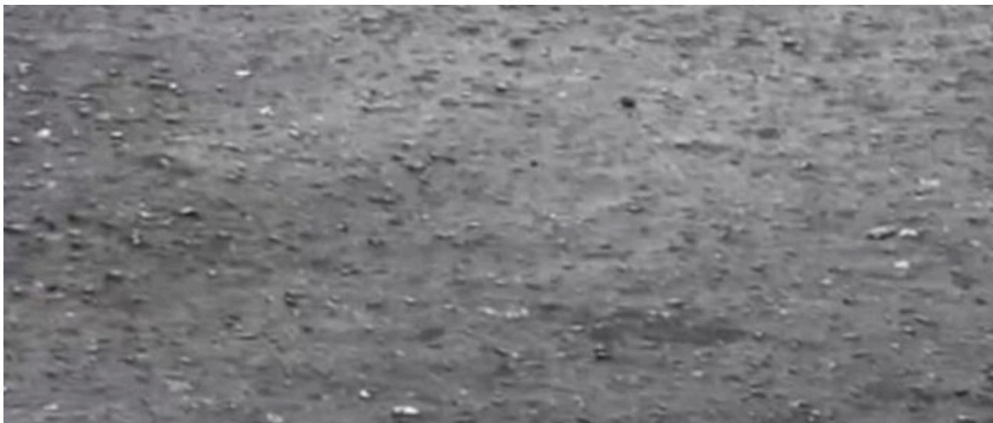
El País Denuncia verificó en terreno el estado de las vías reportadas por la comunidad.

El edil explicó que, pese a la intervención ejecutada, el tramo de la Calle 22N con Carrera 9N continúa en deterioro , lo que afecta la movilidad en el barrio Santa Mónica Residencial.