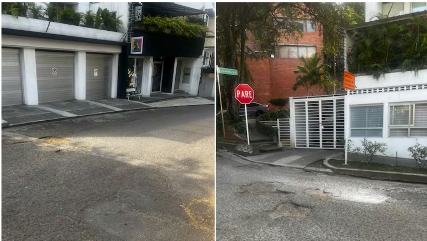
Tramo en mal estado en la Calle 18N y la Calle 22N, uno de los sectores que la comunidad había prioritizado para su reparación.

Tras la denuncia por el estado de las Calles 18N y 22N, la Secretaría de Infraestructura explicó el avance del plan de intervención vial en la Comuna 2.