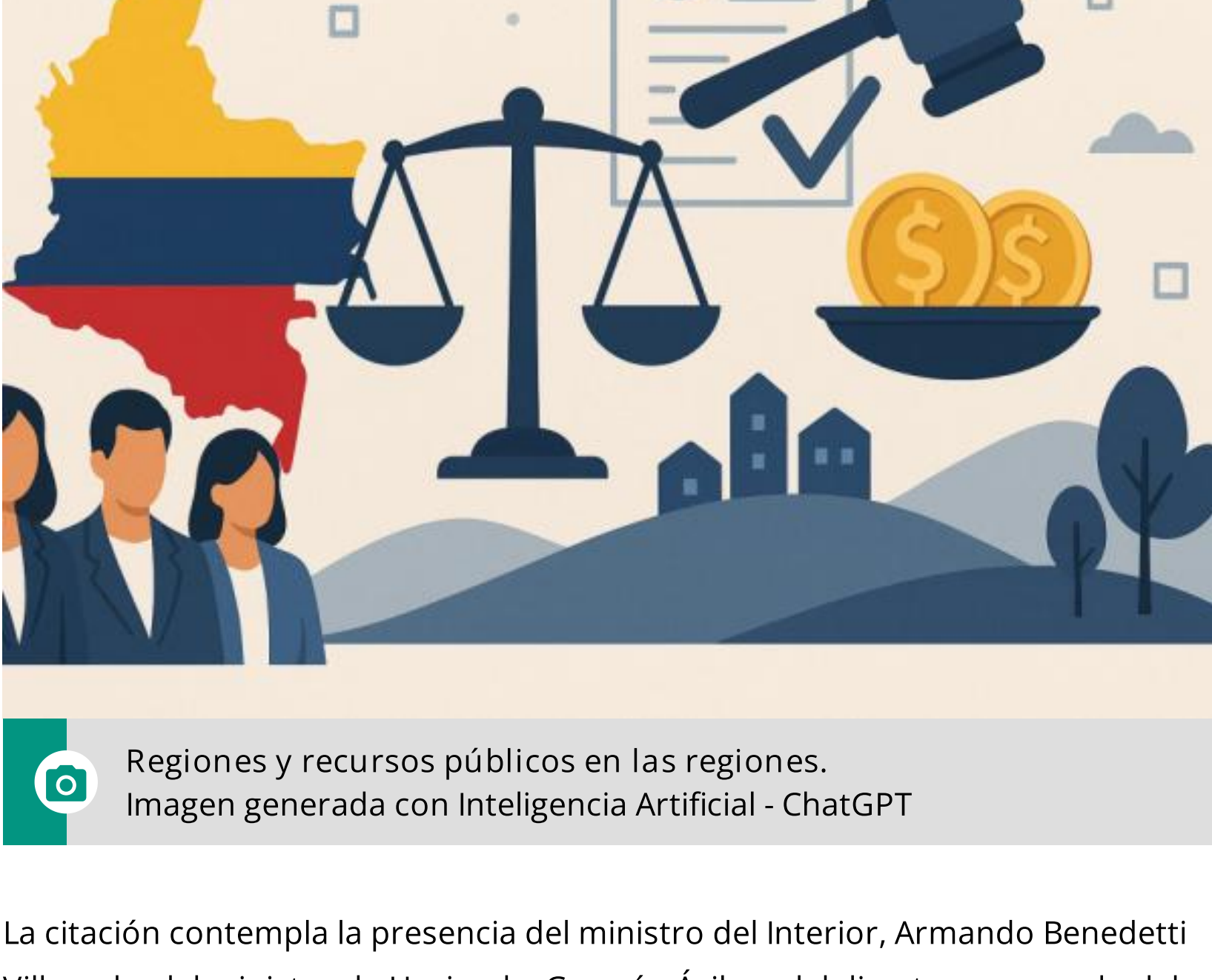
Regiones y recursos públicos en las regiones. Imagen generada con Inteligencia Artificial - ChatGPT

Desde el Legislativo explicaron que la discusión se dará en un contexto de alta expectativa institucional, luego de que el Gobierno nacional confirmara que el primer borrador del proyecto de ley estará listo en la última semana de mayo, pese a los contratiempos que han tenido los encargados con los últimos cambios en el gabinete.