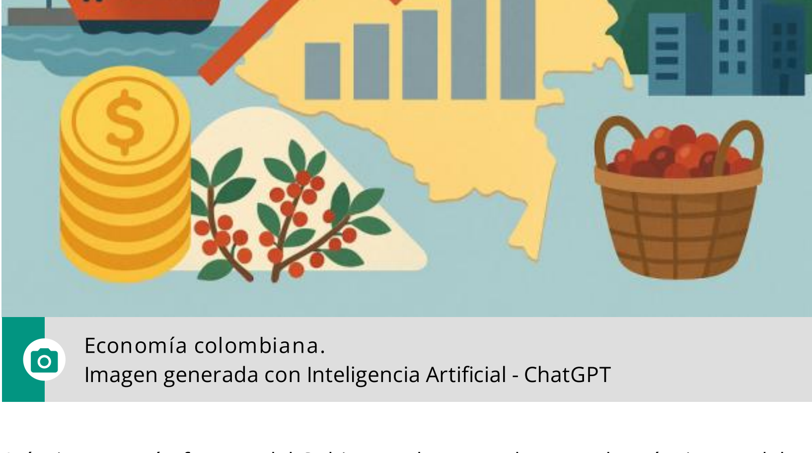
Economía colombiana.