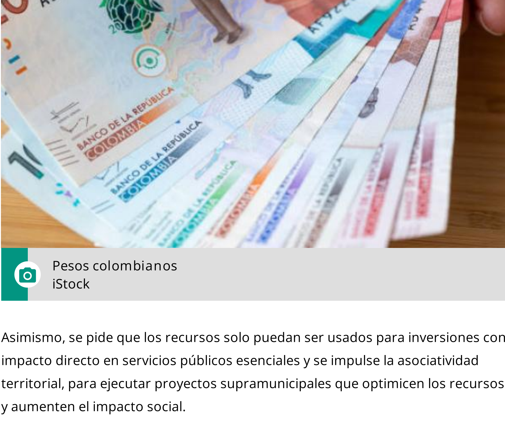
Pesos colombianos

Entre las principales preocupaciones de los departamentos está el uso indebido de los recursos del SGP, por lo que proponen que el proyecto de ley prohíba expresamente su destinación para gastos de funcionamiento, pagos de fallos judiciales, conciliaciones extrajudiciales, o cobertura de déficits fiscales, salvo en casos puntuales de municipios pequeños. También plantean reglas estrictas para evitar la generación de nuevos pasivos laborales no autorizados, un punto sensible en el manejo presupuestal local.