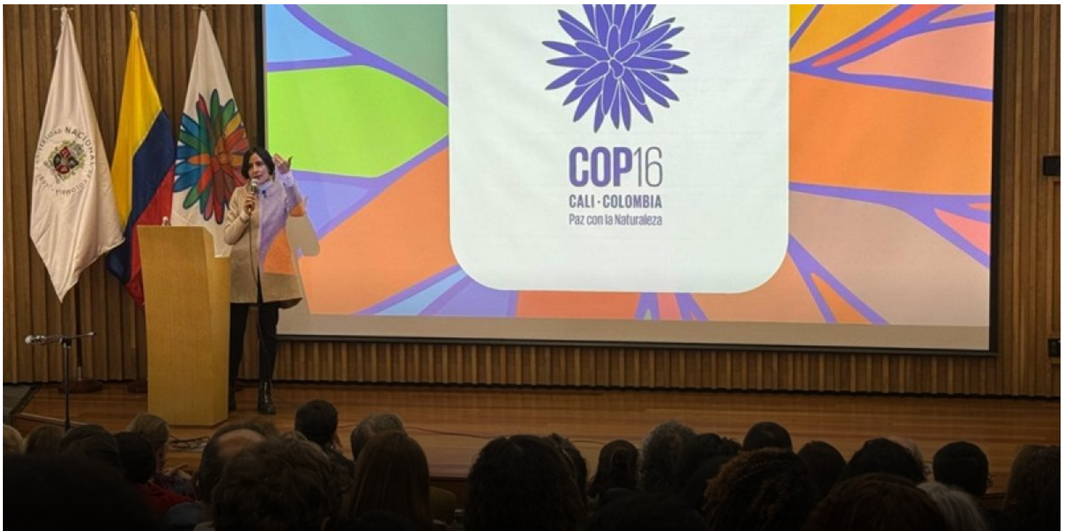
COP 16, sede Colombia.