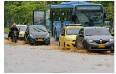
Alerta naranja en Cali ante emergencia por lluvias en la ciudad