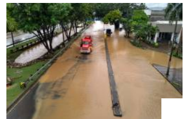
Cali se 'inundó': impactantes imágenes de la emergencia invernal 2021